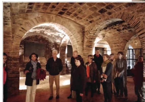
Exceptionnelle cave voûtée, une cathédrale amoureusement dédiée au vin Gaillacois.